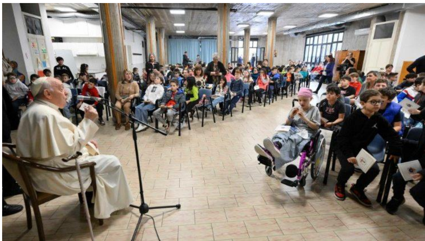
Đức Thánh Cha Phanxicô hỏi đáp với trẻ em tại giáo xứ Rôma

Một em trả lời: cùng với gia đình, con luôn cầu nguyện trước mỗi bữa ăn.